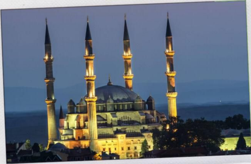
Selimiye Camii ve Külliyesi

Osmanlı İmparatorluğu'nun İstanbul'dan önce başkentliğini yapmış Edirne şehrindeki Selimiye Camii ve Külliyesi, 2011 yılında UNESCO Dünya Miras Listesi 'ne dahil edilmiştir.